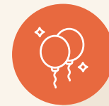
Troolin yhteiset tapahtumat