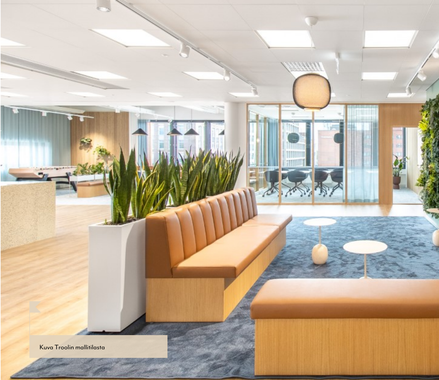
Kuva Troolin mallitilasta

LähiTapiolan Parempaa tilalle -palvelukonsepti auttaa keskittymään siihen mitä parhaiten osaat – kiinteistöön ja tiloihin liittyvät asiat voit jättää huoletta meille. Troolin omistavat LähiTapiola Keskinäinen Henkivakuutusyhtiö sekä LähiTapiolan kiinteistörahastot.