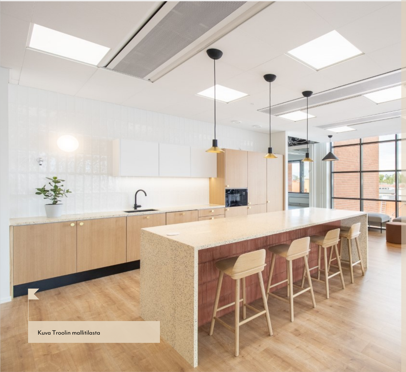
Kuva Troolin mallitilasta