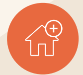
Joustavaa työtilaa ja pientoimistoja

Troolin sisäpiha ja kesäterassi uudistetaan 2023-2024 aikana. Kuva on taiteilijan näkemys lopputuloksesta eikä vastaa toteutusta.