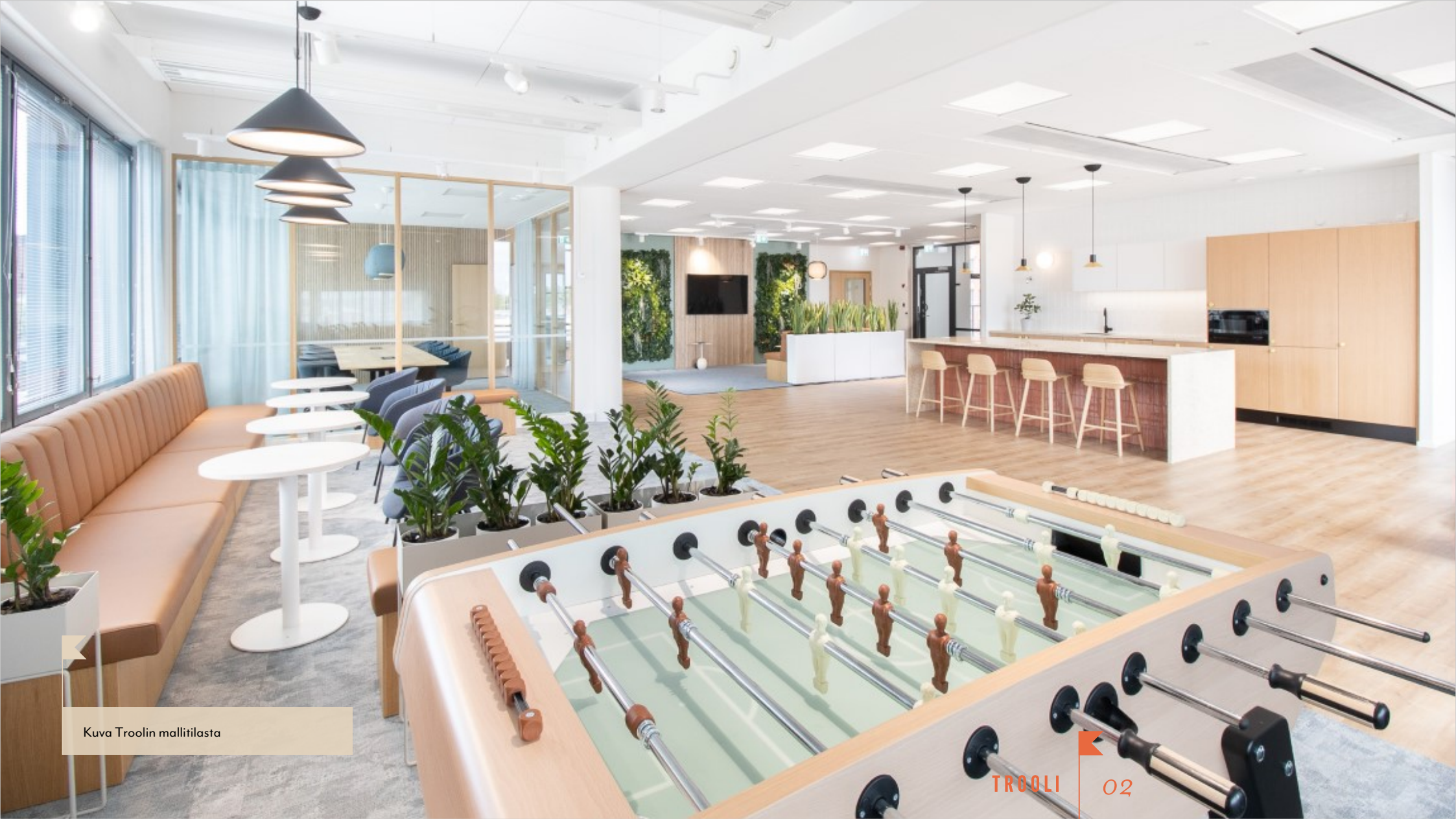
Kuva Troolin mallitilasta