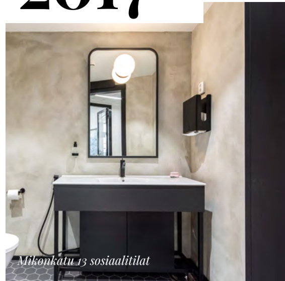
Mikonkatu 13 sosiaalitulat