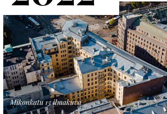
Mikonkatu 13 ilmakuva