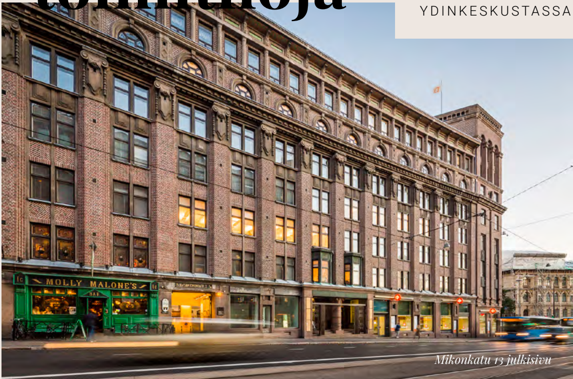
Mikonkatu 13 julkisivu

HISTORIALLINEN ARVOKIINTEISTÖ HELSINGIN YDINKESKUSTASSA