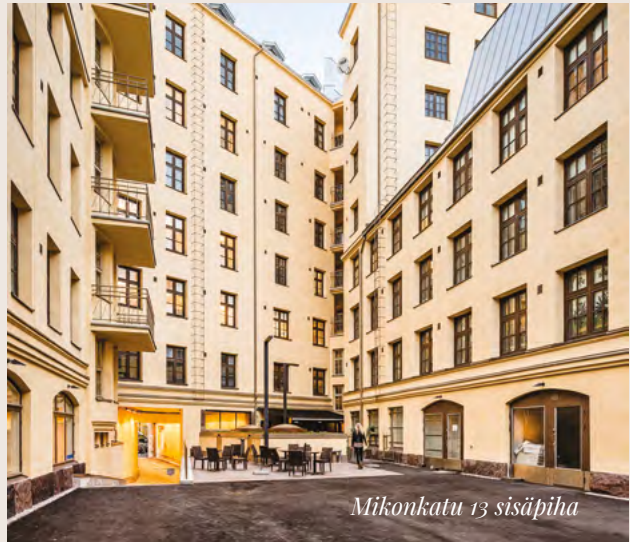
Mikonkatu 13 sisäpiha

Mikonkatu 13 Helsingin ydinkeskustassa, vain muutaman askeleen päässä Rautatieasemasta ja keskellä maan kattavimpia palveluja, tarjoaa moderneja ja joustavia toimitiloja merkittävässä arvokiinteistössä. Keskeisen ja näkyvän sijaintinsa sekä muokattavissa olevien tilojensa puolesta, kiinteistö on erinomainen yrityksille, jotka haluavat sijoittua keskeisesti kaupunkikuvassa sekä räätälöidä tarpeitaan ja toimintonsa vastaavat tilat.