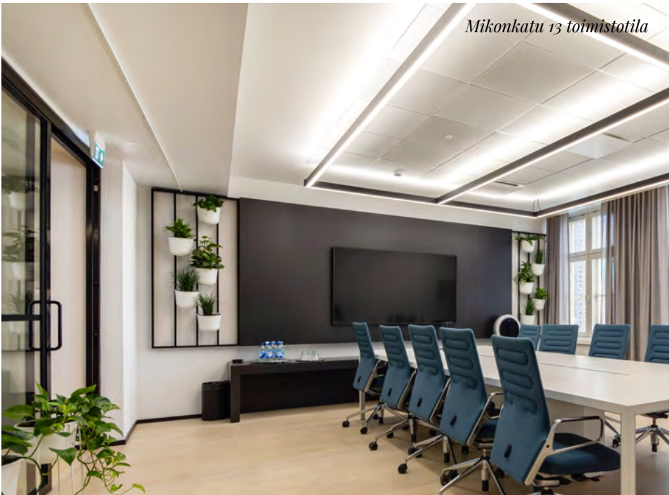
Mikonkatu 13 toimistotila